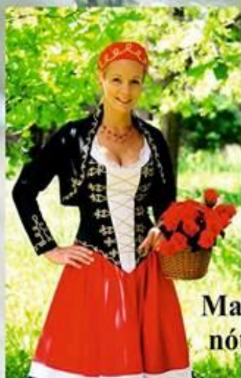
Magyar Rózsa nóta énekes

Részvételi díj 20 lej / fő ami magában foglalja az élő zenét, a több fogásos vacsorát és üdítőt