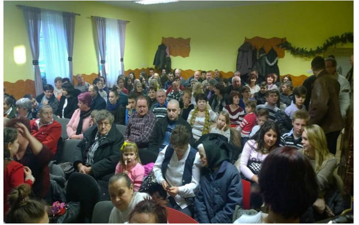
A képek a tavalyi rendezvényen készültek

Az idén ismét megrendezzük a farsangibált Hegyköztótteleken, ezúttal január 31-én, szombaton délután 3 órai kezdettel a helyi kultúrotthonban.