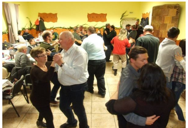
A képek a tavalyi rendezvényen készültek