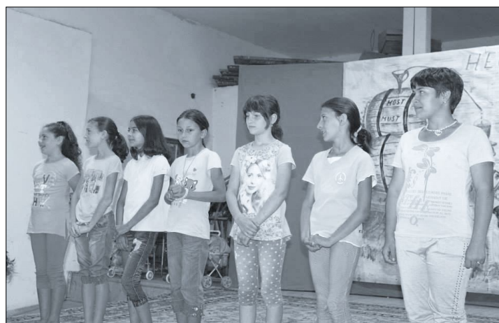
2015 Évzáró – 2,3 osztály