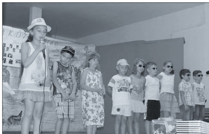
2015 Évzáró – Siter, Sitervölgy