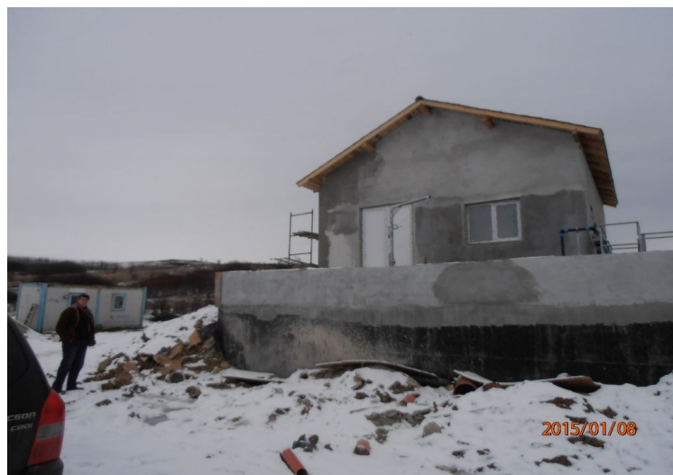
A FALUTÓL EGY KILOMÉTERRE ÉPÜLT FEL A SZENNYVÍZ TISZTÍTÓ TELEP