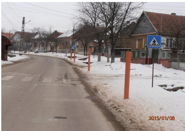
A KIÁLLÓ CSÖVEK JELZIK A SZENNYVÍZCSATORNA AKNÁINAK HELYÉT