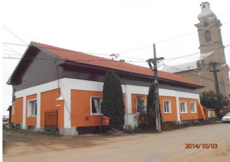
A FELÚJÍTOTT, TETŐTÉRREL ELLÁTOTT POLGÁRMESTERI HIVATAL