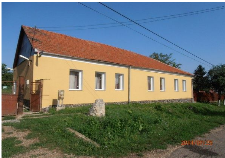
A KÍVÜL-BELÜL MEGÚJJULT HEGYKÖZTÖTTELEKI KULTÚRHÁZ