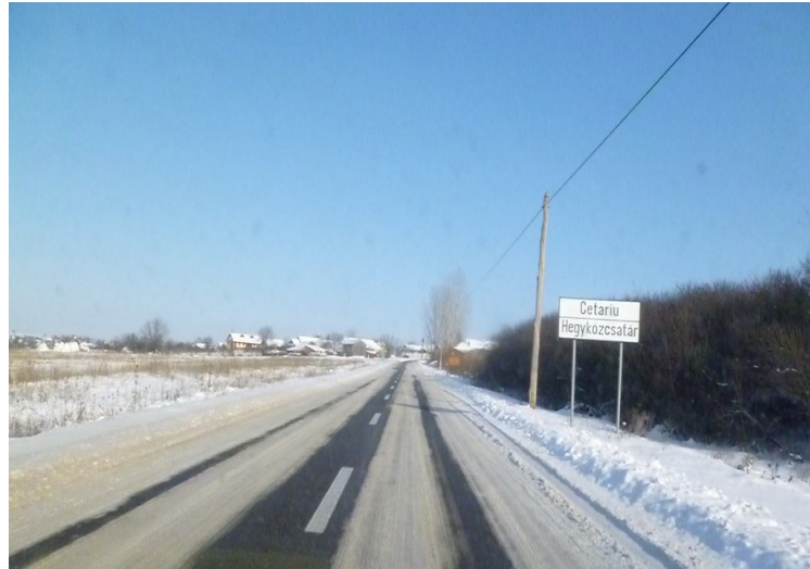
NEM VOLTAK JÁRHATATLAN ÚTAK AZ IDEI TÉLEN