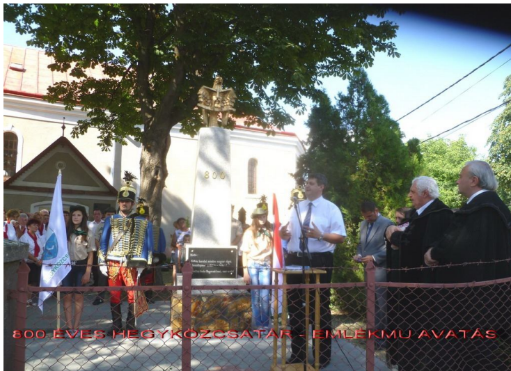
800. ÉVES HEGYKÖZCSATÁR - EMLÉKMŰ AVATÁS

- Egy olyan tervünket sikerült megvalósítanunk, amely régi álmunk volt, egy emlékművet. Tavaly ünnepelte Hegyközcstár írásos dokumentumok alapján, fennállásának 800 éves évfordulóját, ebből az alkalmából egy emlékművet állítottunk, ennek oldalára márványlapokat helyeztünk el az I. és II. Világháborúban elesett hegyközcstári lakosok tiszteletére. Úgy tapasztaltam ez egy nagyon sikeres rendezvény volt.