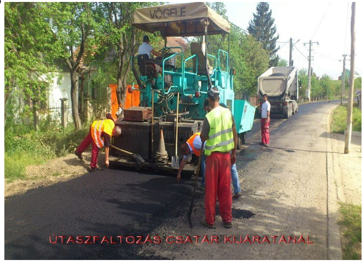
ÚTASZFALTOZÁS CSATÁR KIJÁRATÁNÁL

ezzel 1,5 kilométernyi utat a településen is, vagyis Síterben.