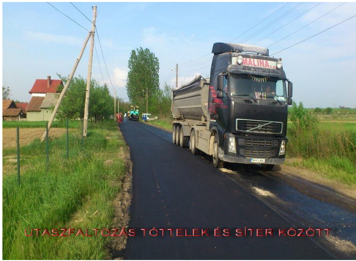
ÚTASZFALTOZÁS TÓTTELEK ÉS SÍTER KÖZÖTT