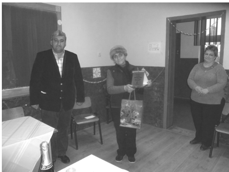
AZ EGYIK KITÜNTETETT— RAT VICTORIA