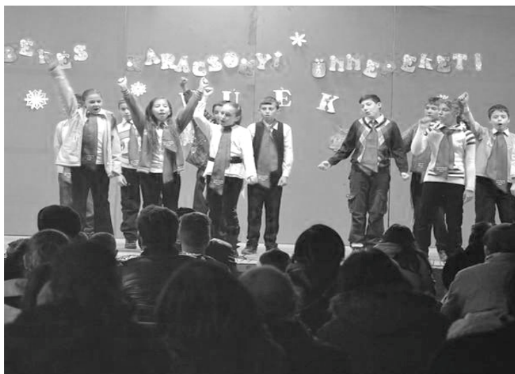
ÉS A CSATÁRI ISKOLÁSOK

Karácsony a család és a szeretet ünnepe, de vajon fel tűnik számunkra, hogy karácsony érkezése nagyon sok embernek nem ünnep, nem az örvendezés ideje, nagyon sok hajléktalan marad az utcán, rengeteg szegény ember éhezik, számtalan családban a bú és könnyhullatásnak napjai ezek.