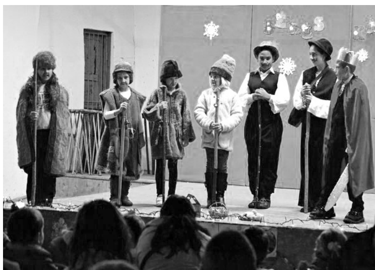
A BETLEHEMI PÁSZTOROK

Karácsonykor ajándékokkal lepjük meg szeretteinket, a szülők gyerekeiknek, gyerekek szülőknél és nagyszülőknél, de vajon ettől teljes az ünnep?