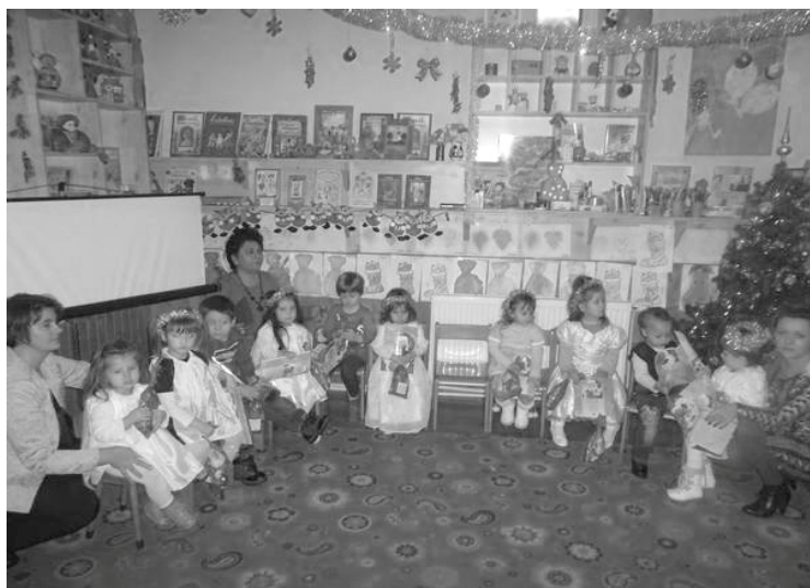
A CSATÁRI ÓVODÁSOK

A karácsonyi szünetet megelőző hétvégén együtt várták az örömfény eljövetelét szülők és gyermekeik a hegyközcsatári kultúrotthonban