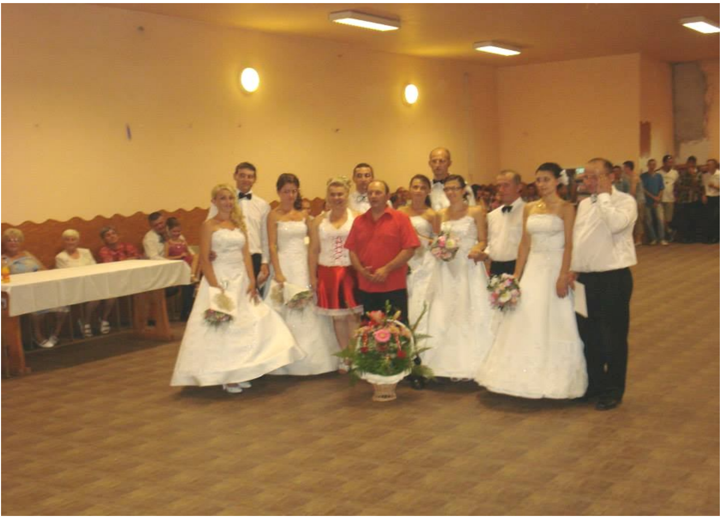
MENNYASSZONYIRUHA ÉS TÁRSASÁGITÁNC BEMUTATÓ