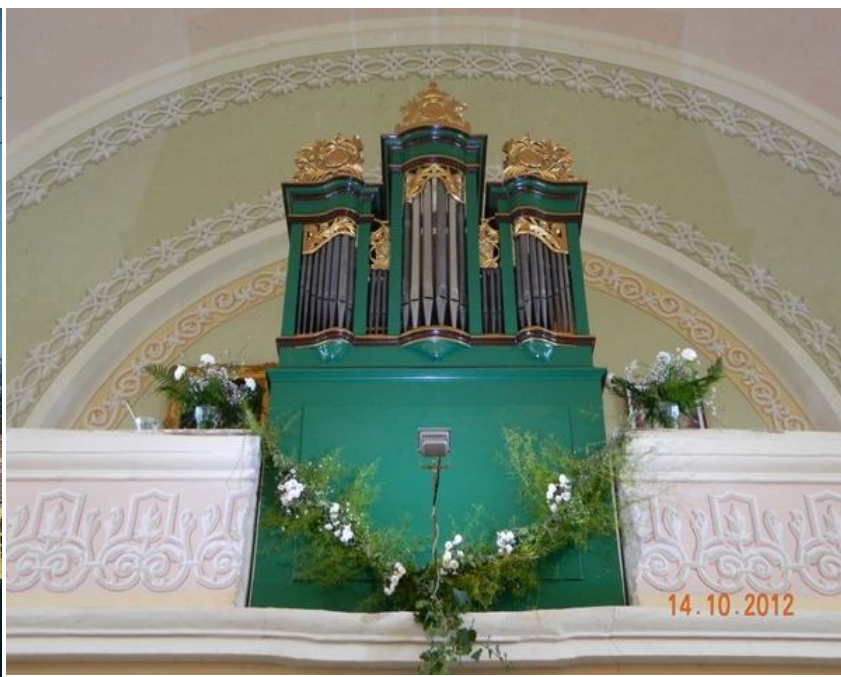
A FELÚJÍTOTT ORGONA