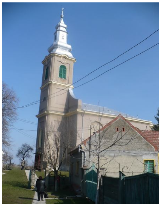
A HEGYKÖZTÓTTELEKI TEMPLOM