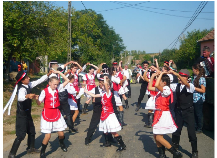
Szüretibál 2011 Hegyközcsatár