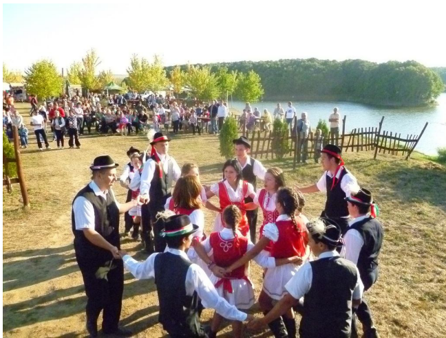
A hegyközsatári Szalmavirág néptáncscsoport 2011-es Sítéri Gesztenye fesztiválon