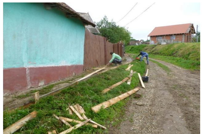
Május 15-én is dolgoztak a járda építésén