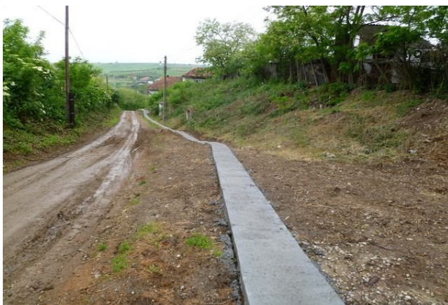
Az elkészült új járda

Az első fázisban körülbelül egy kilométer járdát építünk Csátár utcáin és ezeket folytatni fogjuk a többi településünkön is.