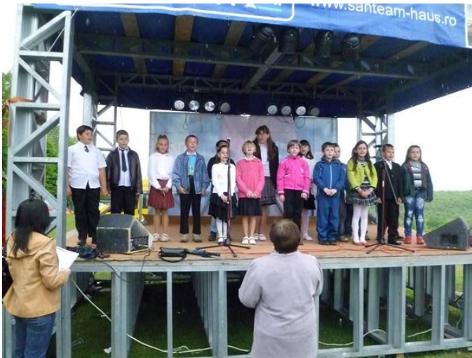
Hegyközi Majális 2010 - a csatári gyerekek