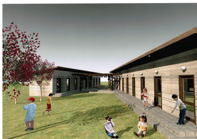
A diáktábor látványterve