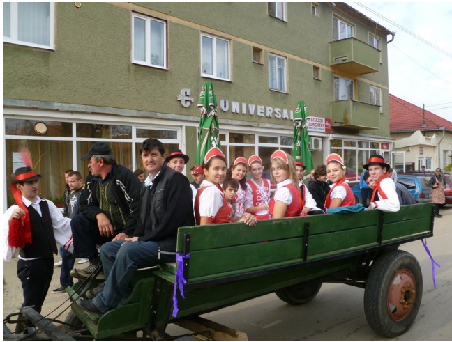
A sítéri szüretibálosok hívogatnak Csátárban 2011