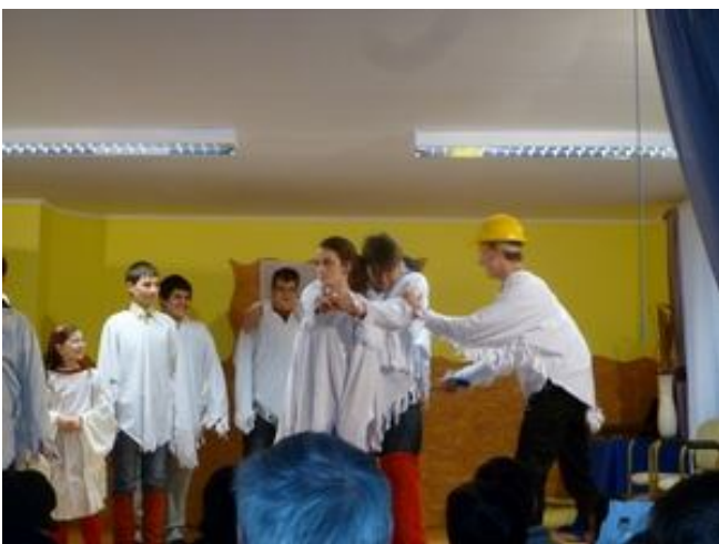
Farsangi mulatság Hegyköztötteleken 2012 februárjában