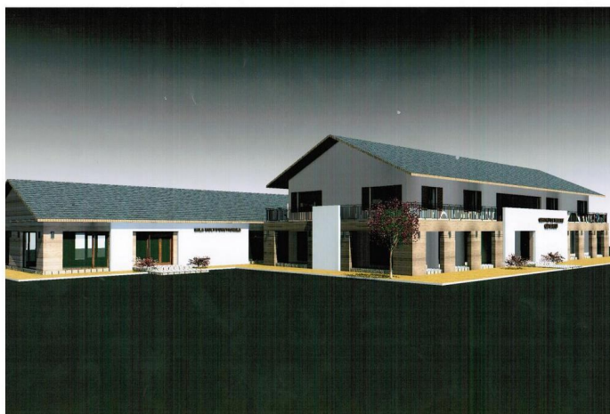
A diáktábor látványterve