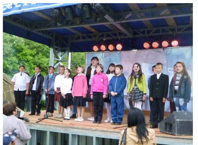
Hegyközi Majális 2010— a csatári gyerekek