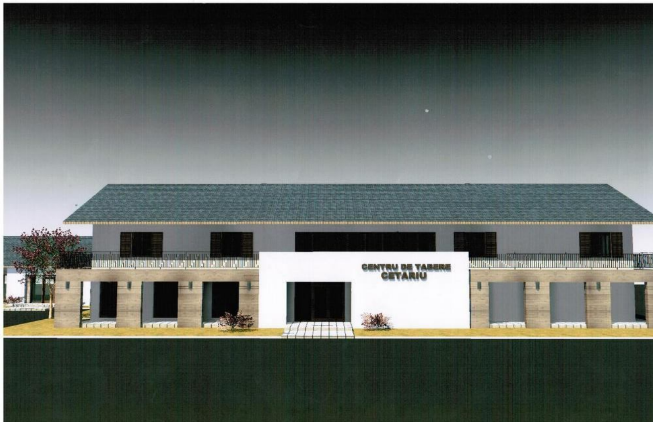
A diáktábor látványterve

Ellentétben a rosmájú híresztelésekkel a Hegyközcsatár község (Csatár, Tóttelek, Sítér és Sítervölgy) gyerekei a rövidesen felépülő sportkomplexumot és diáktábort INGYEN ÉS BÉRMENTVE használhatják majd .