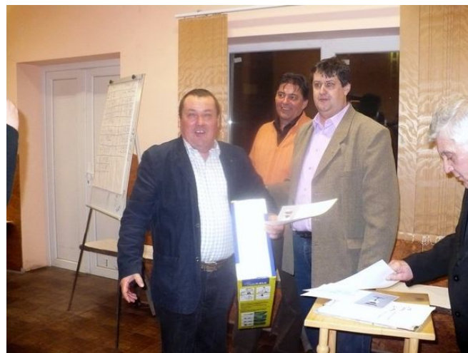
Örül a győztes, hiszen 2009-ben az ő bora lett a legjobb a Hegyközön