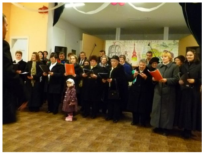
A Falu Karácsonyán Hegyközcsatárban együtt ünnepeltek a község lakosai felekezeti hovatartozás nélkül, a Csatári református és a Tötteleki római katolikus vegyes kórus nagy sikerrel szerepelt