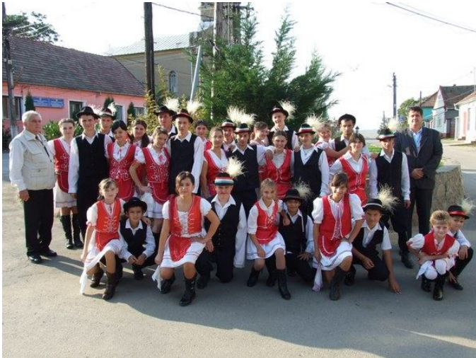
Szüretibál 2011 Hegyközcsatár