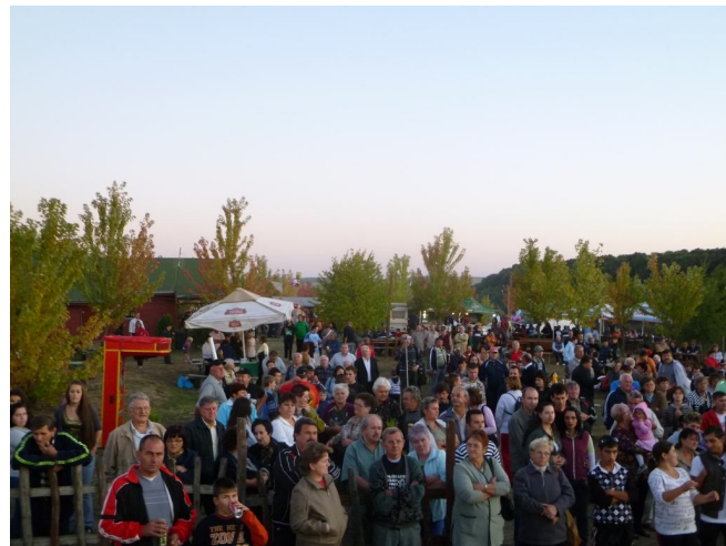
Sokan kijöttek a sítéri tónál megrendezett Gesztenye fesztiválra, ahol élő koncertet adott a 3+2 együttes