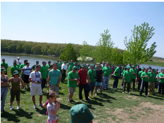
Sokan vettek részt, 61 csapat a VI. Partiumi RMDSZ horgászversenyen