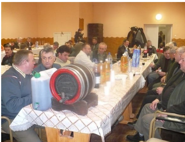
A hegyközi borok megmérettetése 2009-ben a hegyközsatári kultúrotthonban