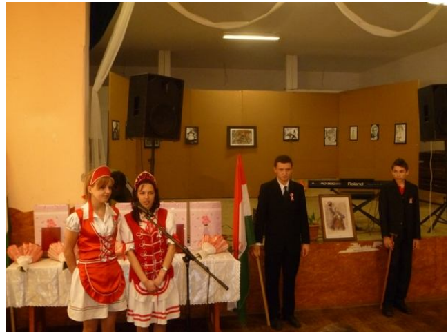
A fiatalok díszőrséget álltak a magyar zászló mellett