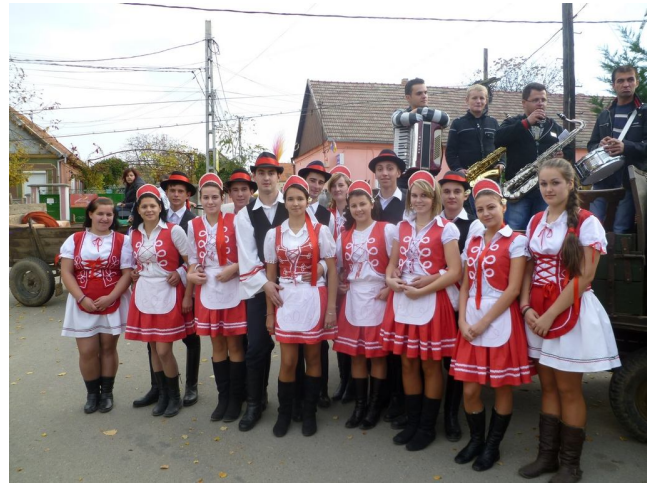
A sítéri szüretibálosok hívogatnak Csátárban 2011