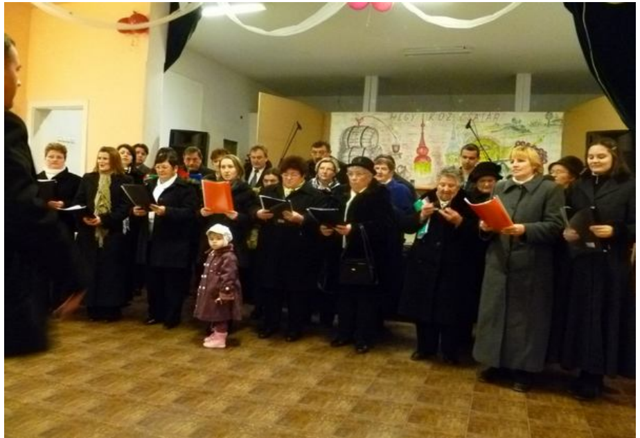
A HEGYKÖZCSATÁRI REFORMÁTUS ÉS HEGYKÖZTÓTTELEKI RÓMAI KATOLIKUS EGYHÁZKÖZSÉGEK VEGYES KÓRUSA

Karácsonykor a világon mindenhol Krisztus születésének örömhírét ünneplik. Az emberek a templomokban adnak hálát Istennek a legnagyobb ajándékért, a megváltást hozó Jézusért. Fel kell ismerni Isten végtelen szeretetét, és nekünk is erre kell törekedni, ez minden felekezet legfontosabb üzenete.