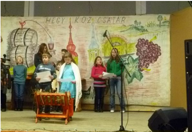
A HEGYKÖZCSATÁRI REFORMÁTUS GYEREK BETLEHEMES JÁTÉKA