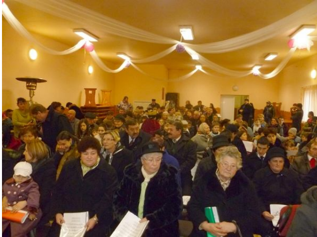
SOKAN VOLTAK AZ ELSŐ FAU KARÁCSONYA RENDEZVÉNYEN