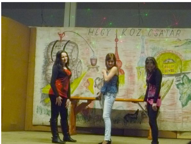
A HEGYKÖZCSATÁRI BAD GIRLS LÁNYOK