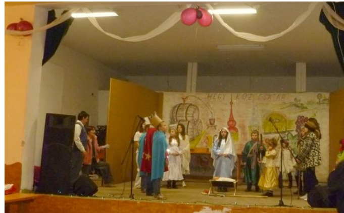
A HEGYKÖZCSATÁRI RÓMAI KATOLIKUS GYERE- KEK BETLEHEMES BEMUTATÓJA

megrendezett Dalfesztiválon bekerültek a legjobb tizenöt közé.