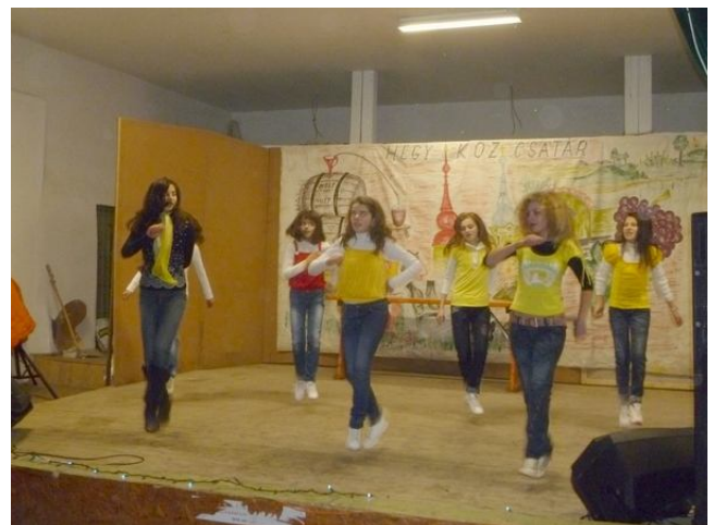
AZ ÚJONNAN ALAKÚLT SZIKRA MODERTÁNC CSOPORT ELSŐ BEMUTATKOZÁSA