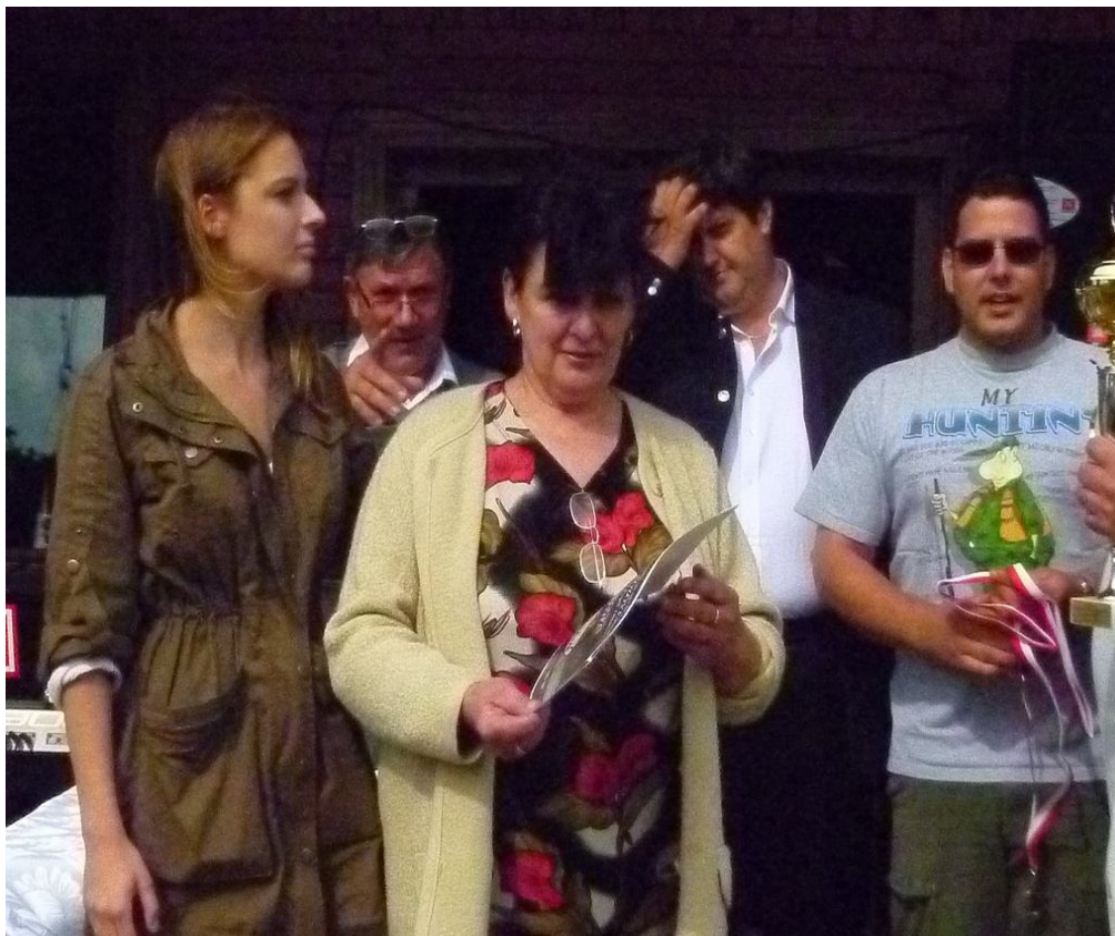
A GYŐZTES KABAI CSAPAT

lehetőség is. Saját áramfejlesztővel biztosítják az állandó áramellátást.