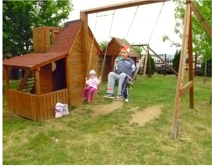
JÁTSZÓTÉR GYEREKEKNEK A TÓPARTI ÉTTEREMNÉL