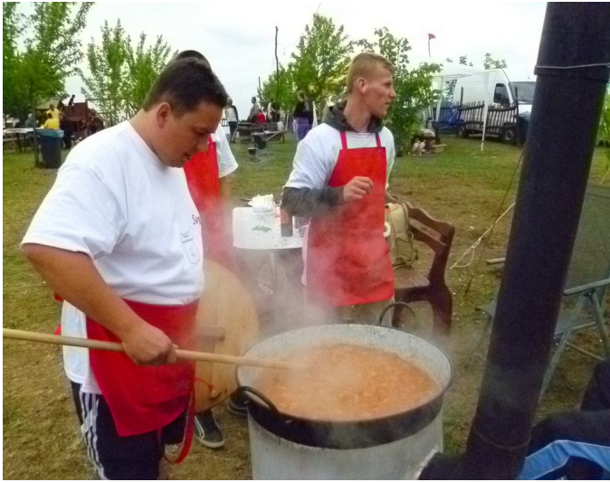
A HEGYKÖZI BOGRÁCS BETYÁROCK