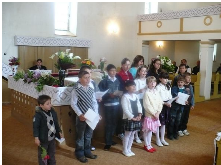
A HEGYKÖZCSATÁRI GYEREKEK 2010—BEN, ANYÁKNAPJÁN EGY ZENÉS—VERSES ÖSSZEÁLLÍTÁSSAL KEDVESKEDTEK AZ ANYUKÁKNAK ÉS NAGYMAMÁKNAK

Manapság, Jarvis igyekezetének hála, illetve későbbi ellenségeskedése ellenére, évente egyszer szerte a világon megemlékeznek az édesanyákról. Bár nem esik mindenhol ugyanarra az időpontra, például Dániában, Finnországban, Olaszországban, Törökországban, Ausztráliában és Belgiumban ugyanabban időben tartják az Anyák napja ünnepét, mint az Egyesült Államokban: május második vasárnapján. Nálunk az elsón.