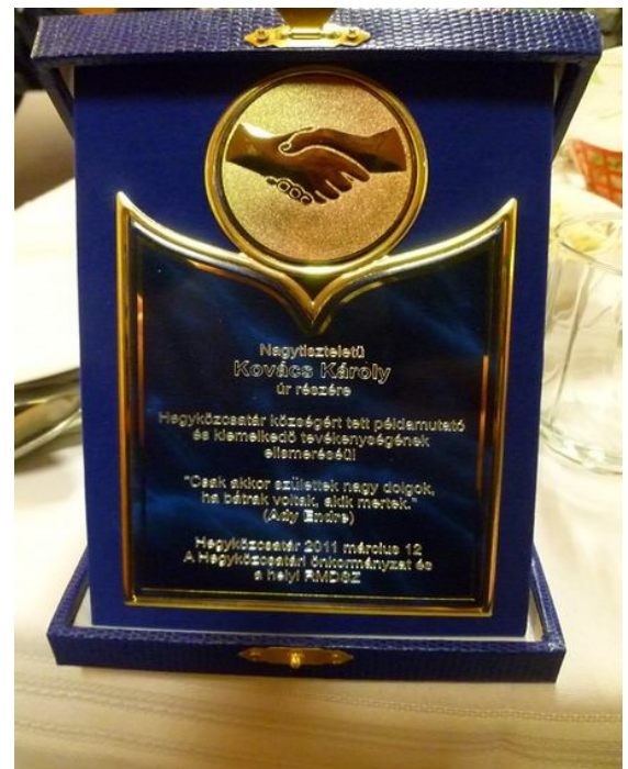
AZ ÉLETMŰDÍJJAL JÁRÓ EMLÉKPLAKETT

Sokan összegyűltek március 12-én délután a hegyközcstári kultúrotthonba, ahol hármas ünnepség vette kezdetét 18 órai kezdettel. Ezzel párhuzamosan kiállítást is megtekinthettek a jelenlévők, cserépedények, kerámiák és építőipari termékekből ( cserép, téglá ), amelyek a XIX. illetve XX. század termékei.