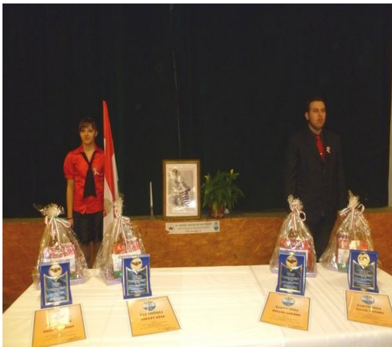
A RENDEZVÉNY IDEJE ALATT FIATALOK ÁLLTAK DÍSZŐRSÉGET

Ünnepség sorozat volt Hegyközcstárban március 12-én szombaton délután, hiszen az 1848-49-es szabadságharc és forradalom áldozataira emlékeztek, de Életműdíjat és Emlékplakettet is adtak a XX. század hegyközi „forradalmárainak”, valamint ismét találkozhattak a hegyközi szőlősgazdák.