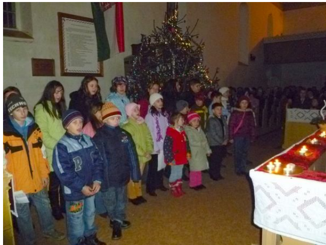
A GYERTYAFÉNYNÉL FELCENDÜLT A „CSENDES ÉJ... NÉPSZERŰ KARÁCSONYI ÉNEK