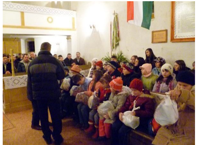
A GYEREKEK ÖRÜLTEK AZ AJÁNDÉKOKNAK

A Polgármesteri Hivatal és a nagyváradi Teréz Anya alapítvány jóvoltából Mikulás csomagokat osztottak a község óvodáiban, amelynek nagyon örültek a gyerekek.